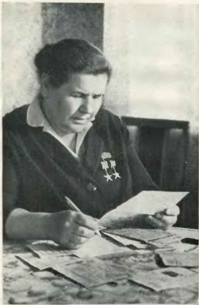
Вісім — десять листів — така щоденна пошта депутата.