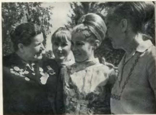
Серед учасників обласного змагання молодих доярок.