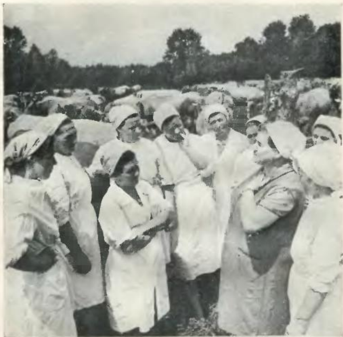
В літньому таборі