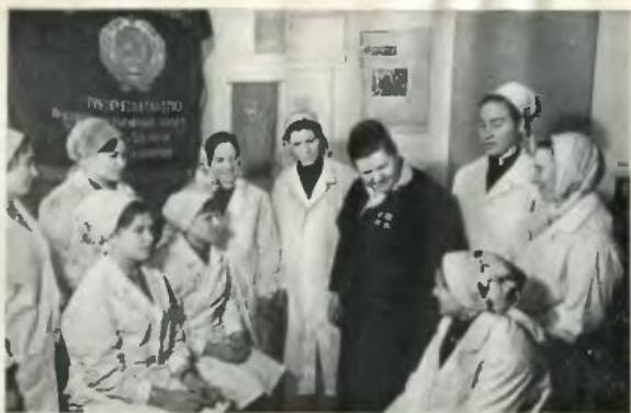
Серед слухачів школи передового досвіду.