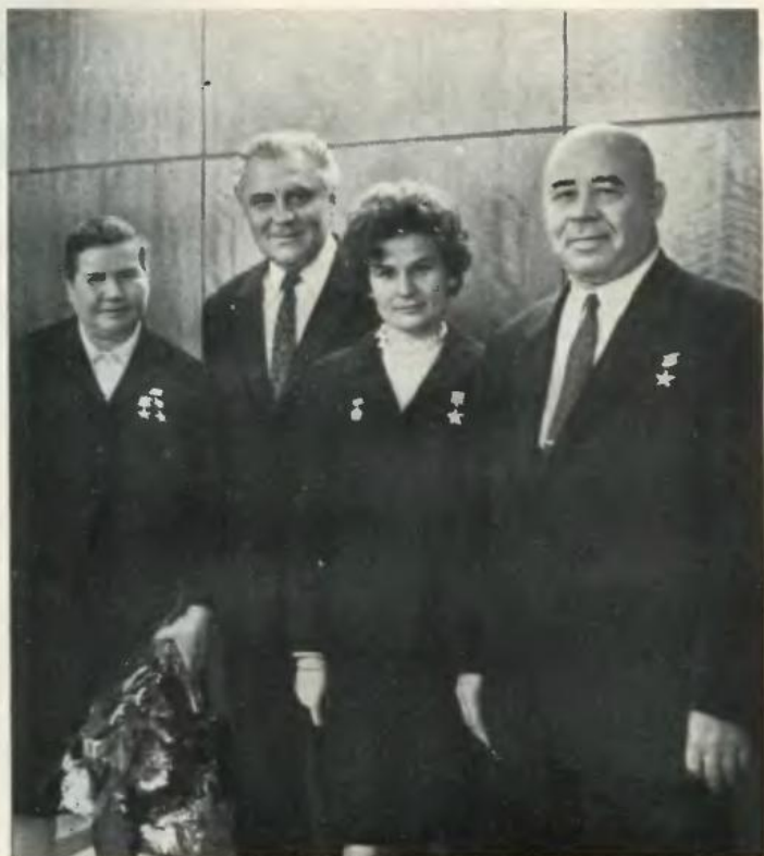
На фото (справа наліво): член Політбюро ЦК КПРС, Перший секретар ЦК КП України П. Ю. Шелест; голова Комітету радянських жінок, перша жінка-космонавт, Герой Радянського Союзу В. В. Ніколаєва-Терешкова; член Політбюро ЦК КПРС, Голова Ради Міністрів УРСР В. В. Щербицький; двічі Герой Соціалістичної Праці М. Х. Савченко на зборах активу жінок міста-героя Києва (вересень, 1971 р.).