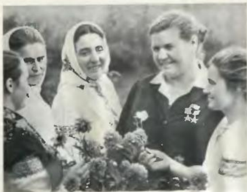
Три покоління токарівських трудівниць-доярок.