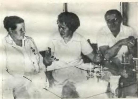
В гостях у німецьких друзів.