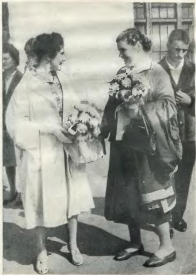
В Парижі українську колгоспницю вітають друзі з Комітету захисту миру.