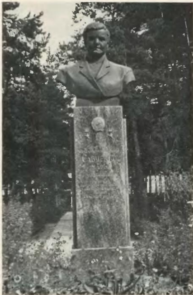
Погруддя героїні в парку біля колгоспного будинку відпочинку.